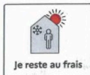
Je reste au frais