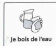
Je bois de l'eau