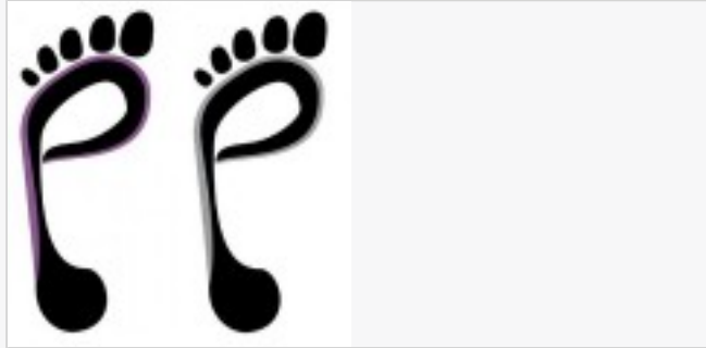
Podologue - Pédicure:

HAUDRY Pierre-Marie 32, bis chemin Raudelauzette - tél: 05.61.46.09.03